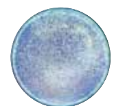
Eau dynamisée avec des fréquences sonores