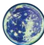
Eau du robinet eau morte

Grâce à la technologie innovatrice d'Aqua Dyn Auroville, l'eau est en permanence baignée par un champ lumineux porteur d'ondes sonores à l'intérieur du réservoir. Une musique sélectionnée et enregistrée (Bach, Mozart, Beethoven...) est diffusée en boucle, portée par des rayonnements infrarouges ou lumineux. Ces ondes sonores optimisent le taux vibratoire de l'eau et augmentent ainsi ses propriétés d'eau vivante.