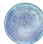
Eau dynamisée avec des fréquences sonores