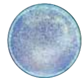
Eau dynamisée avec des fréquences sonores