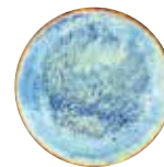
Eau dynamisée eau vivante