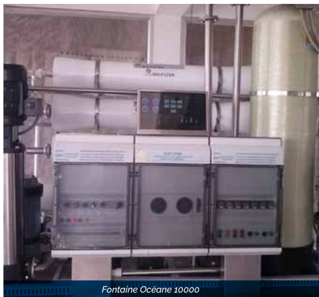
Fontaine Océane 10000

La fontaine Océane est un modèle conçu pour des industries, grandes collectivités (hôtels, universités etc.). Elle peut fournir de 1000 à 1200 litres par heure d'eau pure d'eau pure et vivante grâce à un système à osmose inverse et à son procédé unique de biodynamisation.