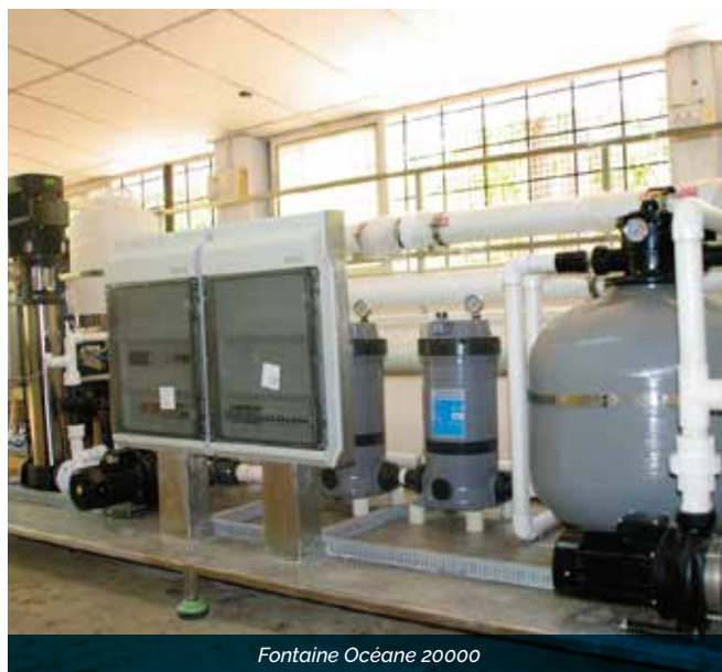
Fontaine Océane 20000

Ces systèmes sont proposés et adaptés suivant la qualité de l'eau à traiter.